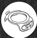
Quick Mount Adjustable

Brug Quick Mount Adjustable eller Clip på en sele. Fastgør lygten på ryggen af hunden, for at sprede lyset i så mange forskellige retninger som muligt. Hvis du vælger at fastgøre lygten på en af siderne, bør det være den side der oftest vender ud mod trafikken.